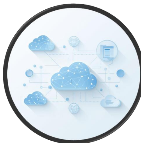
TradeVision FX Cloud